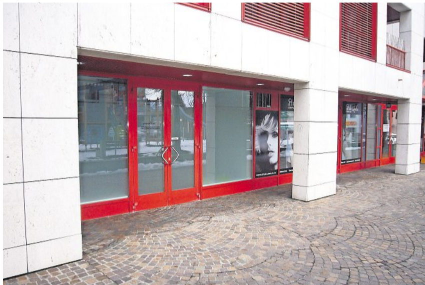
Der neue Standort des Betreibungsamtes Arth befindet sich an der Parkstrasse 4 in Goldau.

Das Anmeldeformular finden Sie unter www.arth.ch/deutschkurse . Sie können sich auch beim Ressort Freizeit, Kurssekretariat, im Rathaus Arth, Telefon 041 859 02 34, E-Mail heidi.gehringer@arth.ch , melden.