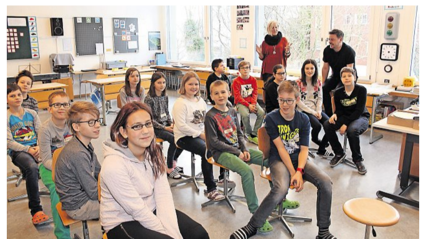
Unter Anleitung von Jrena Zweifel und Padi Bernhard lernen die Kinder und Jugendlichen, nach Lösungen zu suchen – nicht nach Schuldigen.