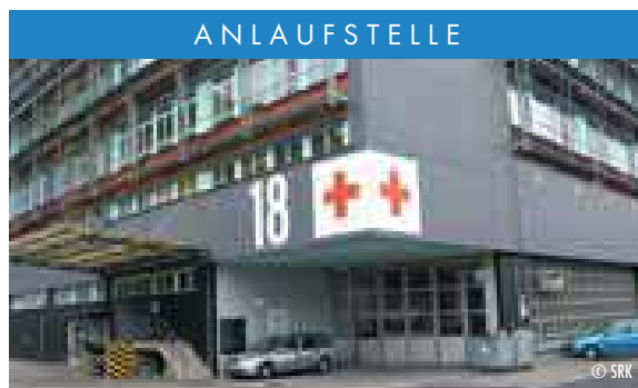
⤴ Hier unterstützt das SRK Menschen ohne Papiere.