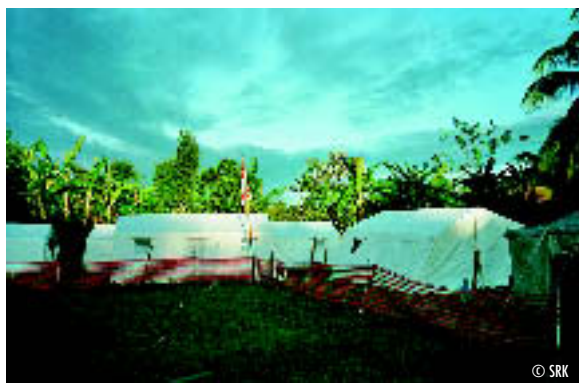
Indonesier, Deutsche und Schweizer haben im Feldspital des Roten Kreuzes an der Westküste Indonesiens 150 ambulante und 15 stationäre Patientinnen und Patienten pro Tag betreut.

«Das Elend, das viele erlebt haben mussten, war ihnen erstaunlicherweise nicht anzumerken.»