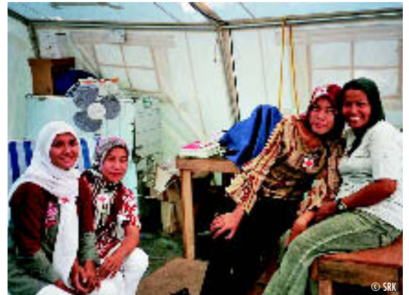
Im Einsatz für ihre Patientinnen und Patienten: Indonesische Mitarbeitende im Notspital des Roten Kreuzes.

Die unbeschreibliche Solidarität. Ein indonesischer Pfleger aus unserem Team stellte zum Beispiel seiner