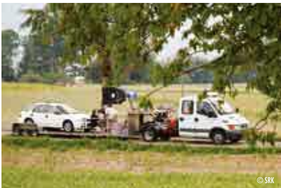
⬆ Bis der Spot im Kasten war, waren ein Dutzend Leute, ein Lastwagen und ein Subaru im Einsatz.

«Hast du deine Mutter noch angerufen?», sagt sie zu ihrem Mann.