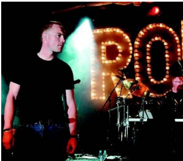
Ronan Keating

Organisé en faveur des «Victimes des catastrophes oubliées», le Bal de la Croix-Rouge suisse 2005 s'est déroulé le 4 juin à quelques kilomètres de Genève et a rencontré un énorme succès. A cette occasion, la Croix-Rouge suisse recevait une superstar, l'interprète Ronan Keating . En clin d'œil aux origines irlandaises de l'artiste, le sponsor Van Cleef & Arpels , a créé un décor de forêt enchantée évoquant les magnifiques paysages de l'île d'Émeraude. Les autres sponsors étaient l' Hôtel Beau-Rivage de Genève, Jet Aviation et BMW .